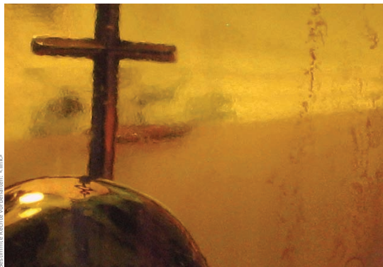
Foto: trazonfreaks - „A Signboard Was Nailed Above Him.“ Bastimente Rechts vorarbeiten -> sinio

lierten Ländern wie zum Beispiel Deutschland mit einem höheren Prozentsatz an Atheismus kann man jedoch durch die Religiosität in einem gewissen Umfang die Lebenszufriedenheit verbessern (Witte, 2011) und damit letztlich die Selbstmordrate verringern.)