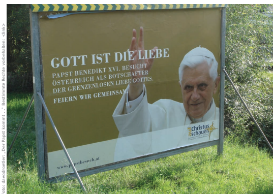
Foto: davorwieder... Der Papst kommt... Bestimme Rechte vorbehalten: -1163-

Welche Werte vertreten die Atheisten? Sie positionieren sich überdurchschnittlich stark gegen die Todesstrafe sowie gegen Krieg und Diskriminierung, haben weniger Vorbehalte gegen Ausländer und haben eine tolerantere Haltung in Bezug auf Sexualität. Bei